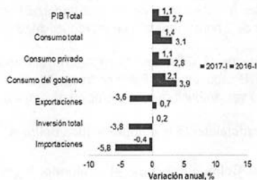
Crecimiento del PIB por componentes de Demanda (2017-I)

Las cifras iniciales de la economía en 2017 han mostrado resultados preocupantes, señalando caídas importantes y constantes en el consumo, la inversión, la producción y la confianza inversionista en Colombia. Incluso, el Producto Interno Bruto del país, para el primer trimestre, creció apenas un 1.1%, mostrando una contracción de la economía de 1.6% en relación con el mismo periodo del año pasado: